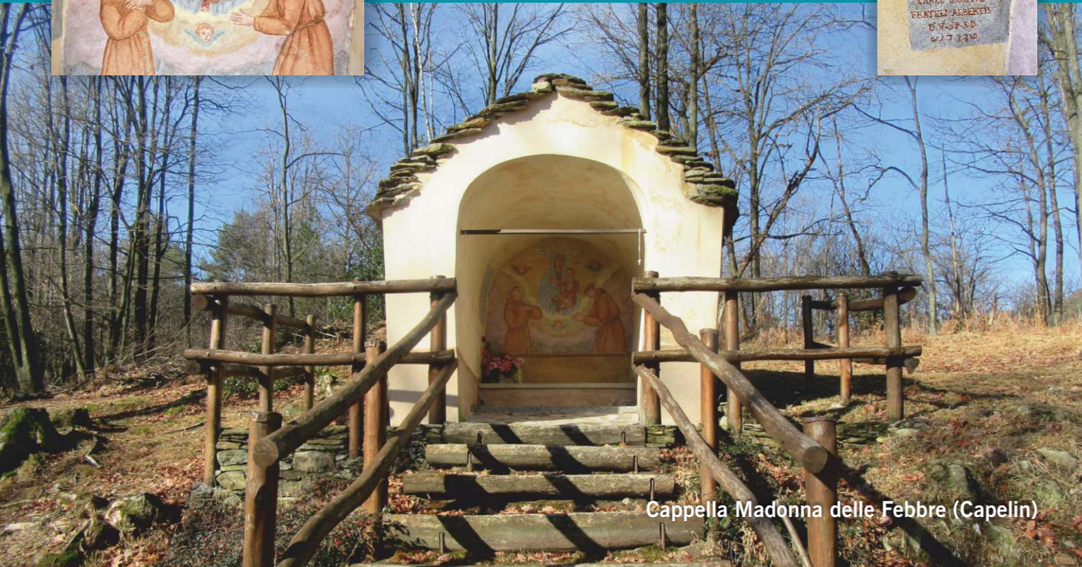
Cappella Madonna delle Febbre (Capelin)